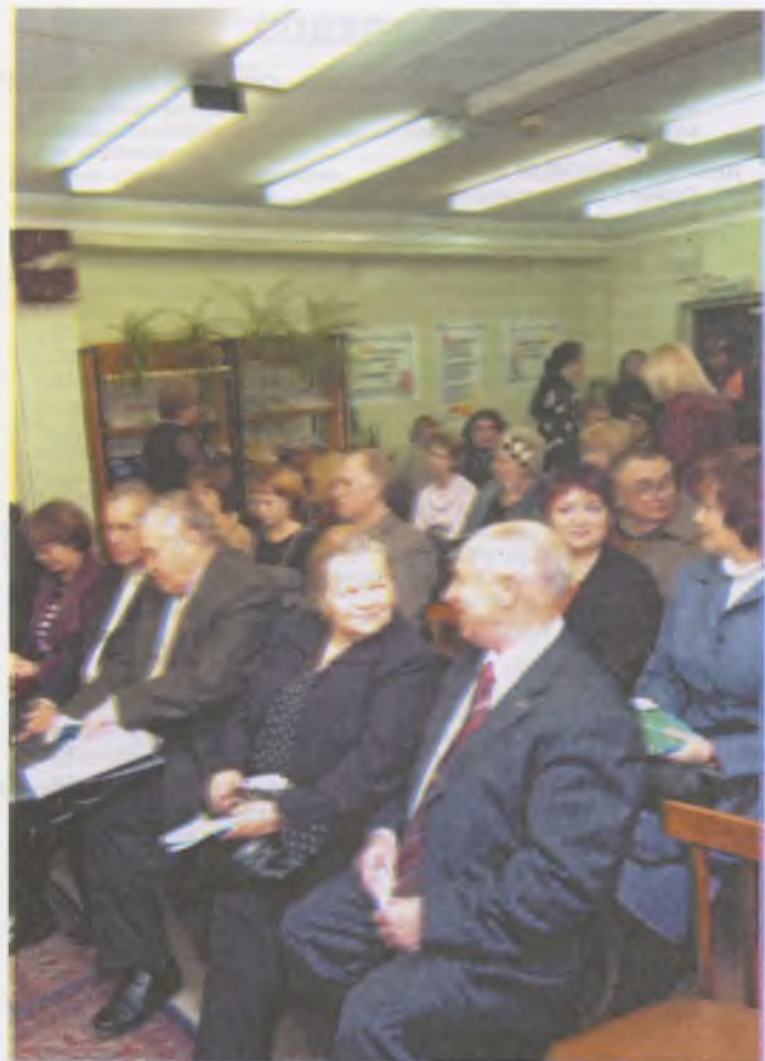
Презентация поэтических сборников В. Шугли и книги «Мой родны кут». Тюменская областная библиотека. 5 октября 2006 г.