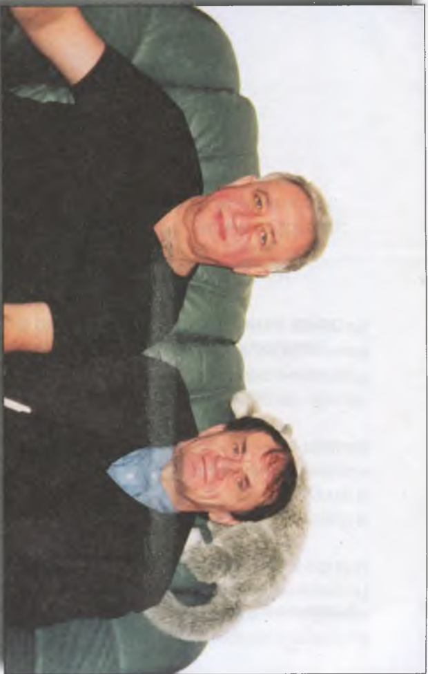
В домашней обстановке с замечательным композитором и другом И. Лученком