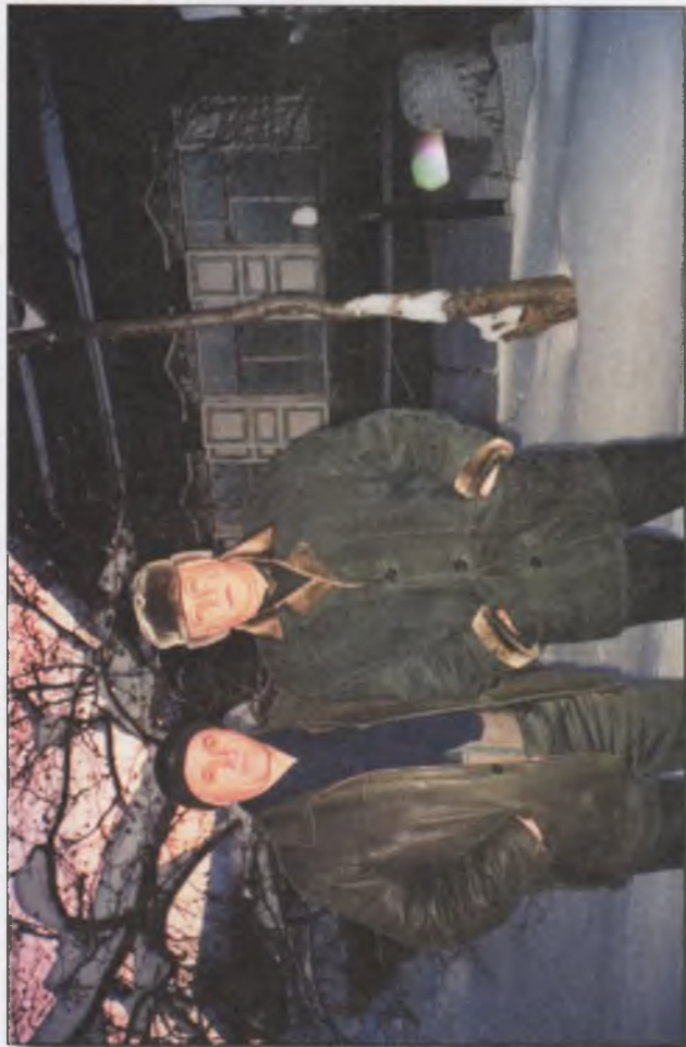
«Старый» отцовский дом. Братья снова вместе