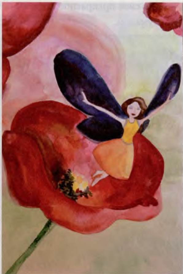
Дрёма (бумага, акварель)

Когда потухли отсветы вечерней зари, когда в лесу почти все птицы окончили песни, и расцвела ночная фиалка, тогда с одного из пышных красных маков спорхнула Дрёма.